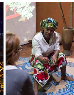
Dans la peau de Nana au Niger