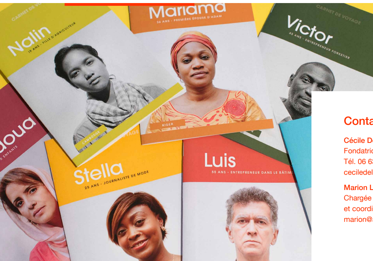
Nés quelque part, 21 personnages dans 7 pays du monde nesquelquepart.fr

« Bravo aux acteurs, et à leur excellent jeu de rôle. Moi femme noire de 25 ans, jouant un homme asiatique père de 2 enfants. Bravo, bravo, bravo et merci d'éveiller les consciences. » Maïwena